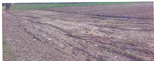
Verhindern Sie Erosionsschäden wie in diesem Frühjahr durch Anlage von Erosionsschutzstreifen!