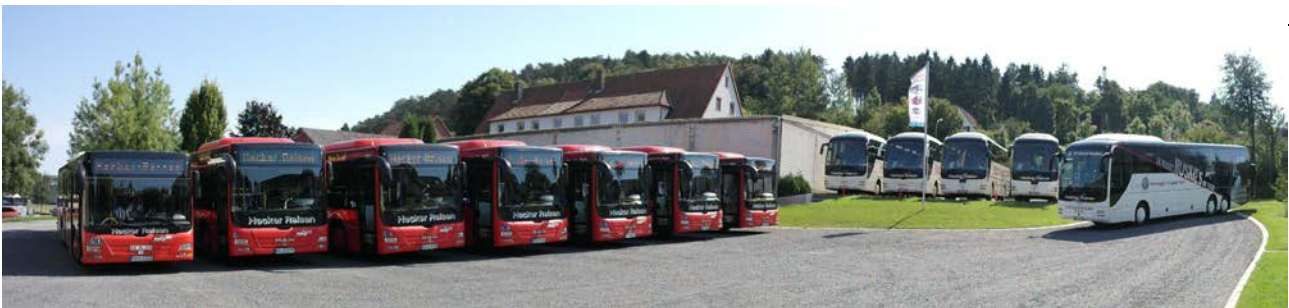
4: Betriebshof Hecker in Liebenau

Alle Informationen und Reiseangebote finden Sie auch im Internet unter www.hecker-reisen.de