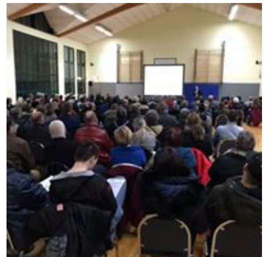
2: Volles Haus bei der Bürgerinformationsveranstaltung der Goetel in Niedermeier

In der Zwischenzeit ist das Zieldatum für die Bündelung nahezu erreicht und Zeit für eine Zwischenbilanz: Niedermeier 80 %, Grimelsheim 64 %, Ersen 57 %, Lamerden 29 %