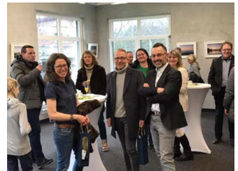
6: Eröffnung Fotoausstellung im Rathaus

Etwa 35 Besucher aus Liebenau und Umgebung wollten es sich nicht nehmen lassen, dieser Vernissage beizuwohnen und wurden mit eindrucksvollen Landschaftsaufnahmen aus unserem wunderschönen Diemel- und Warmetal, einem Gläschen Sekt und kulinarischen Köstlichkeiten belohnt.