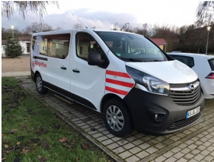
5: Unser Bürgerbus (noch ohne Werbung)

Seit dem 18.02.2020 sind wir endlich unterwegs.