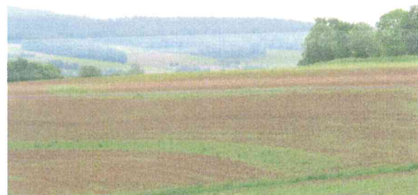
Abb. 3: Erosionsschutzstreifen in Mais aus Wintergerste. Der erste Streifen im oberen Hangbereich verhindert das Zusammenfließen kleiner Erosionsrinnen bevor sie an Geschwindigkeit gewinnen.

HALM-Maßnahmen können jedoch immer nur bis zum 01.10. für die Folgejahre beantragt werden, sodass die Förderung von Erosionsschutzstreifen für dieses Jahr nicht mehr in Anspruch genommen werden kann.