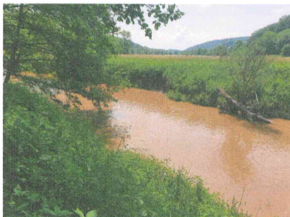
Abb. 1: Gewässer nach Bodenerosion

Bei sehr hängigen Flächen mit 12% Gefälle beträgt der jährliche mittlere Bodenabtrag in Maisfruchtfolgen etwa 7 t/ha 1 . Dadurch geht langfristig wertvolles Ackerland verloren. Auch aus Sicht des Umweltschutzes ist dies problematisch, weil Erosion auf Flächen mit angrenzenden Gräben und Gewässern ein wesentlicher Faktor für die Eutrophierung der Gewässer bis hin zum Meer ist.