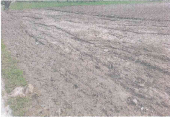
Abb. 2: Erosion im Vorgewende. Der Bereich, der quer zum Hang bestellt wurde, ist von Erosion verschont geblieben.

Die Aussaat orientiert sich am Saattermin des Maises: Ist das Ziel auch im Schutzstreifen Mais zu ernten, wird erst Mais gelegt, der nächsten Regen abgewartet und dann der Schutzstreifen angelegt, um dem Mais etwas Vorsprung zu verschaffen. Schutzstreifen müssen unbedingt auch schon im oberen Bereich eines Gefälles angelegt werden, um das Zusammenfließen kleiner Erosionsrinnen zu größeren Rinnen zu verhindern (Abb. 3).